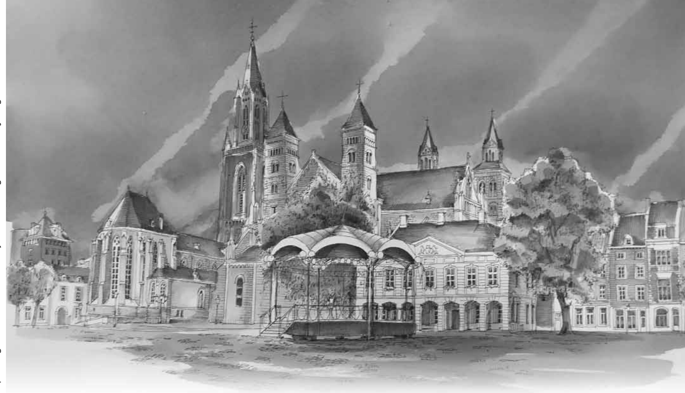
Aquarel getekend met rode wijn uit Limburg door Mathy Engelen.